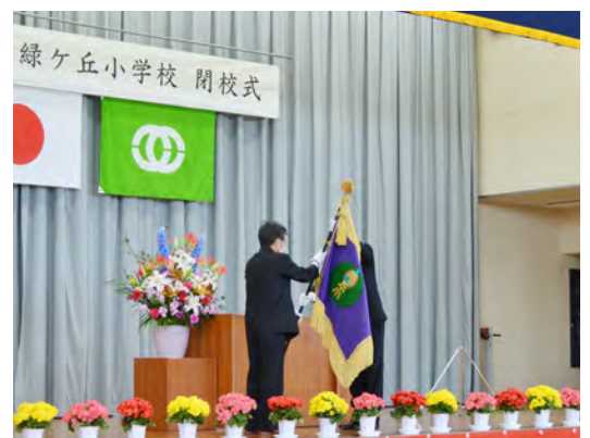
▲3月23日⑩に行われた閉校式で校旗が返納されました（上：旧二宮小学校、下：緑ヶ丘小学校）