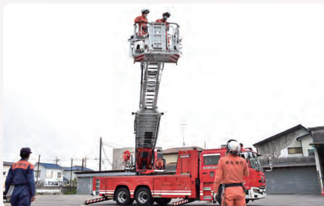
▲30m級の先端が屈折するタイプのはしご車