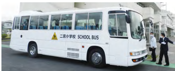
▲スクールバスが運行されます