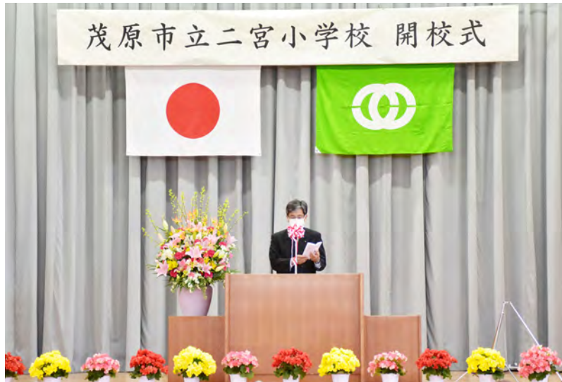
▲4月5日⑩に開校式が行われました