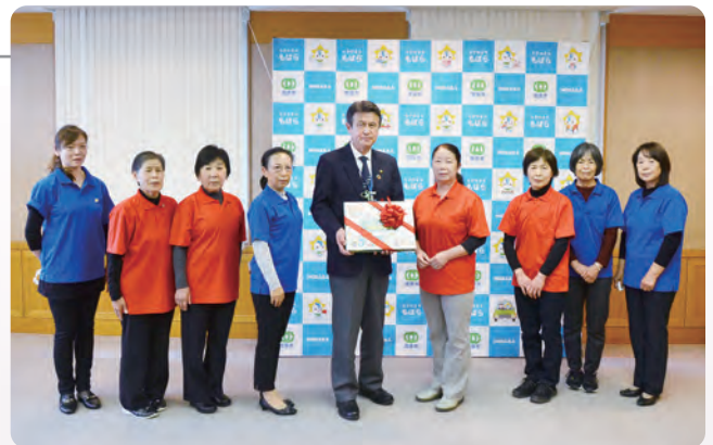
▲解散にあたり保育所に交通安全紙芝居をいただきました

田中市長は、「長年にわたり交通安全活動に尽力いただきありがとうございました」とねぎらいの言葉を述べました。