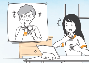
●家族や友人との会話