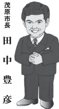
茂原市長 田中豊彦