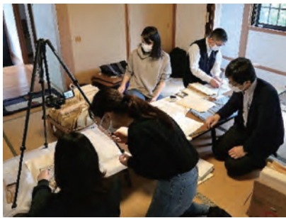
▲上永吉千葉家での史料調査