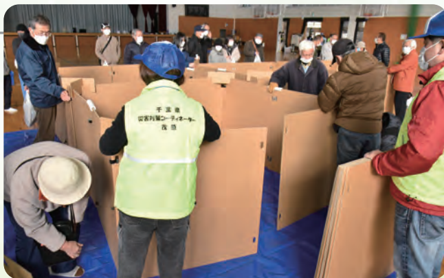
▲ダンボールパーティションの組み立て訓練