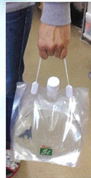
手で簡単に運べます