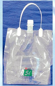
中身がすくなくても自立します