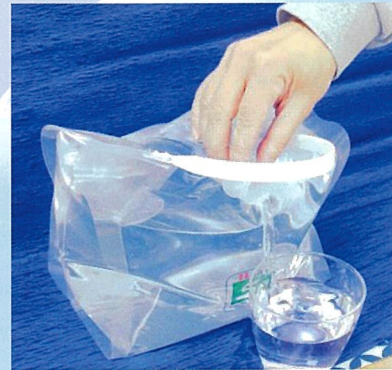
そのまま注げます