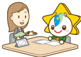
茂原市マスコットキャラクター モバリん