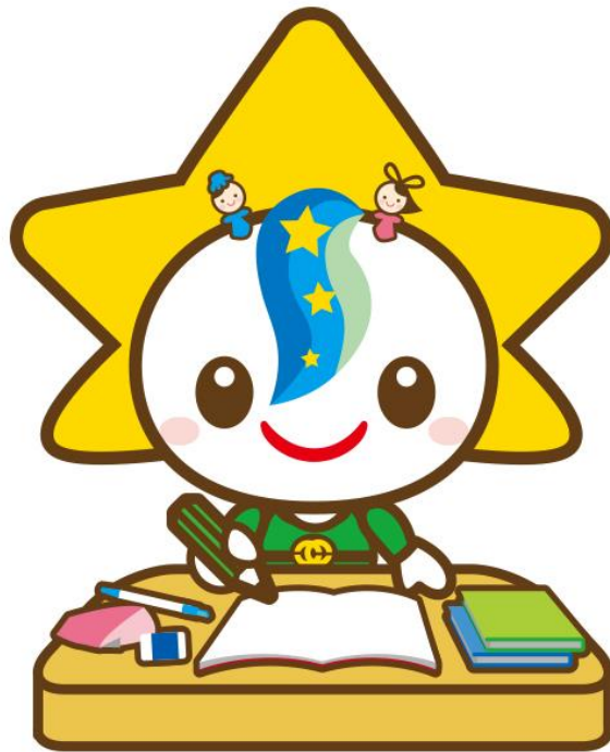
茂原市マスコットキャラクター モバリん