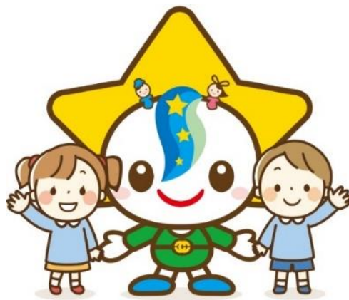
茂原市マスコットキャラクター モバリん