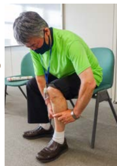
▲「指輪っかテスト」でフレイルを自己チェック！