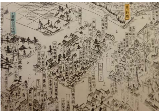
▲本町安川時計店付近 (昭和4年鳥瞰図)