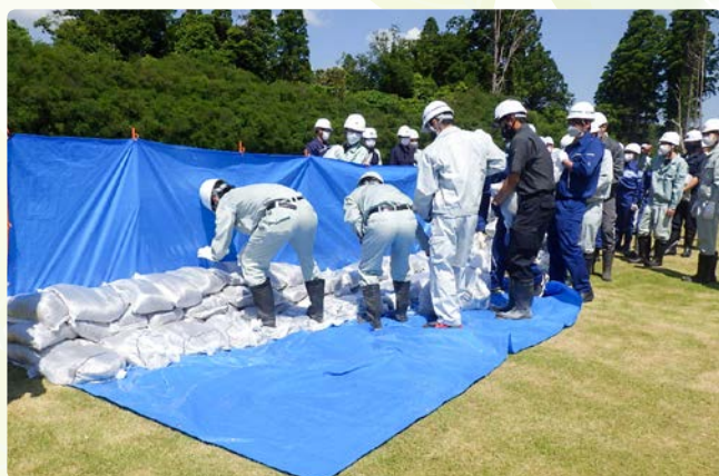
▲改良積み土のう工法の訓練を行いました