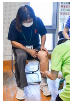
▲ふくらはぎ周囲長