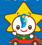
茂原市マスコットキャラクター モバリん