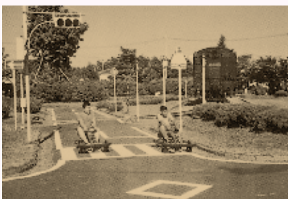
昭和48年に設置された萩原交通公園