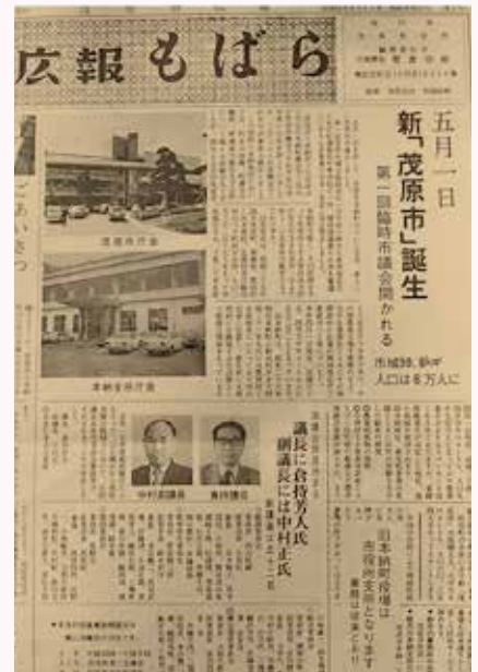
茂原市と本納町が合併したことを報じる広報誌