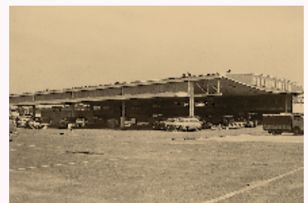
昭和49年に設置された公設地方卸売市場