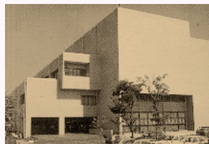
昭和59年に建設された東部台文化会館