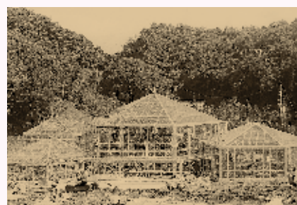
昭和56年に建設が始まった自然活用村 仮称みどりの村(旧ひめはるの里)