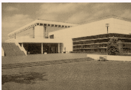
昭和57年に完成した市民体育館