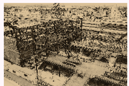
平成2年の駅前再開発ビル建設