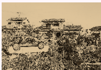
平成2年の竜巻による災害