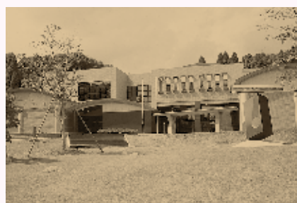
平成6年に完成した美術館・郷土資料館