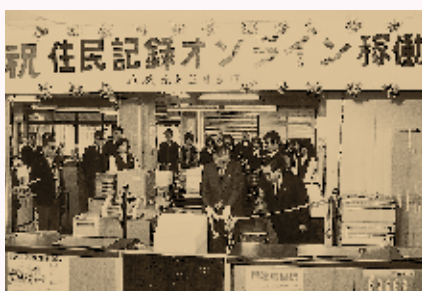
平成元年に住民記録のオンラインが稼働