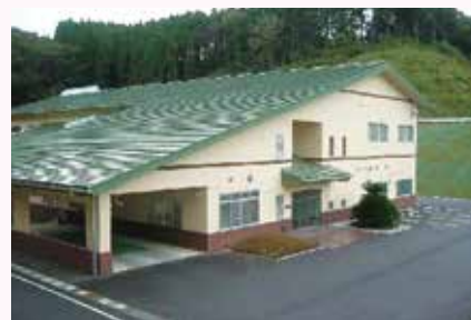
長生郡市広域市町村圏組合、 一般廃棄物最終処分場完成