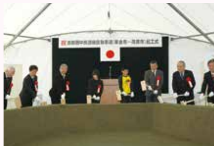
圏央道茂原・東金間の起工式が行われる