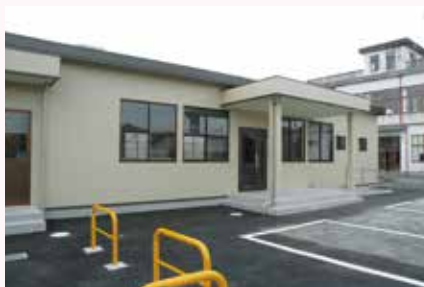
本納支所建て替えに伴う仮設事務所設置