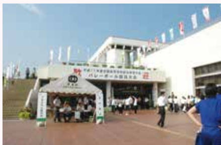
全国高校総体「千葉きらめき総体」開催