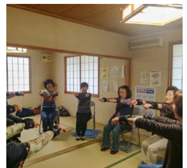
▲もばら百歳体操の様子

A 高齢者の方が健康で過ごせるように、現在市では市内全域で「もばら百歳体操」を進めております。これは地区ごとやグループなどで、週何回か体操していただき、高齢者の皆さんに外に出て運動する機会を増やそうという活動となっております。今後、市としてもPRしていきたいと考えております。