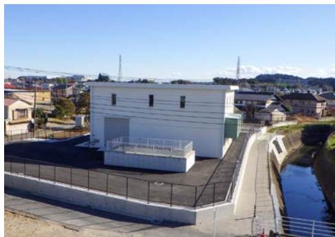
▲早野排水機場（令和4年6月供用開始）