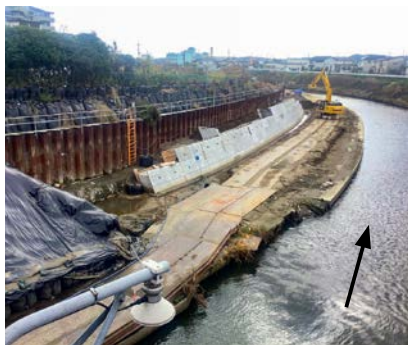
▲河川改修状況（一宮川）

mm、時間最大雨量に換算いたしまして46mmを対象降雨として整備が進められております。