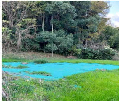
▲適正に管理されている土地

地の状態が分からないケースもありますので、そういう方に対しては現状が分かる写真を同封し、通知しております。適正な管理をしていただけない場合は、電話もしくは訪問など粘り強く交渉し、適正な管理をしていただけるよう努めております。