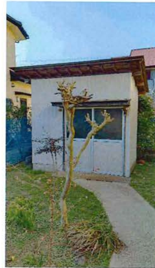
物置(3畳) 2018.9 塗装、屋根トタン張替