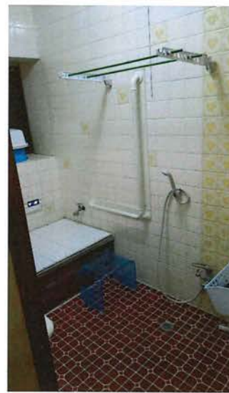
風呂場 2018.1 手すり取付、シャワーフックをならべて簡易物干に