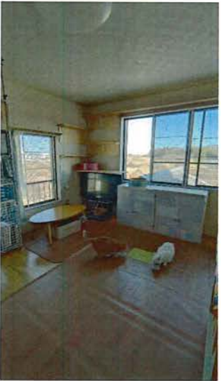
2階 洋間(10畳) 窓に猫脱走防止網