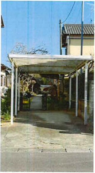
外観 入口より 駐車場1台分