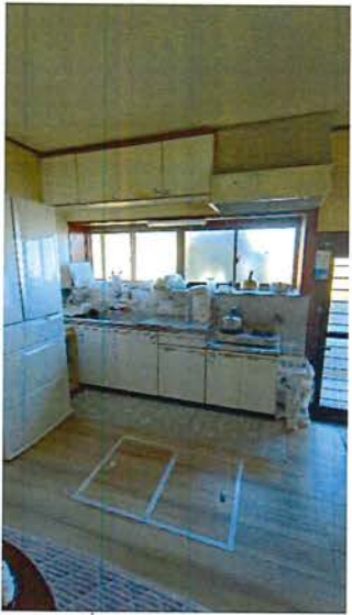
1階 DK(10畳) 2023.9 クッションフロア→フ ローリング工事