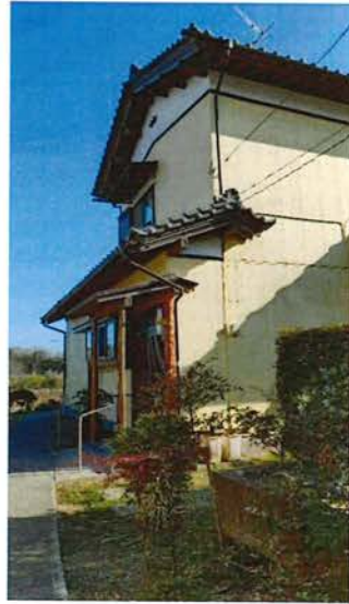
外観 北側より 2021.4 玄関アプローチ手すり 工事