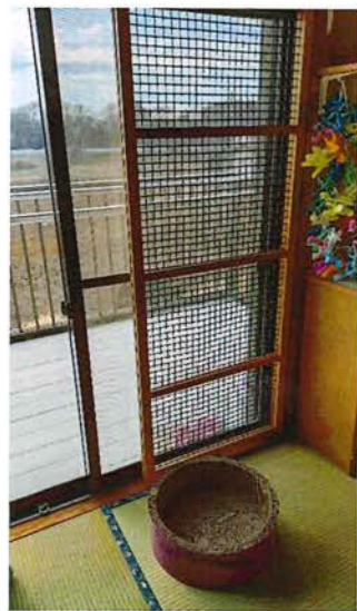
窓に脱走防止網 ベランダに脱走防止扉