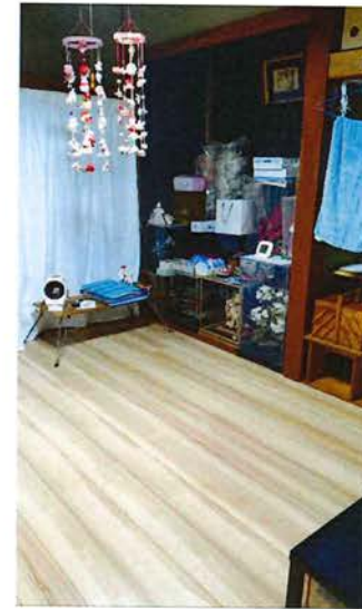
1階 客間(6畳) 2023.9 畳→フローリング工事