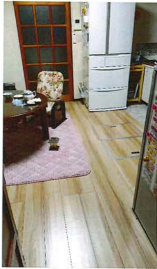
1階 DK(10畳) フローリングは3部屋とも 「イクタ 介護とペット」