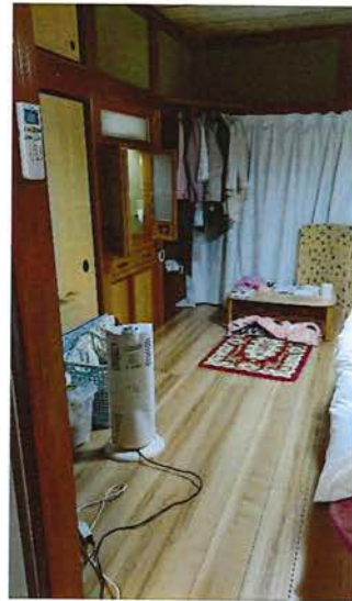
1階 仏間(8畳) 2023.9 畳→フローリング工事 2024.11 窓をペアガラスへ交 換