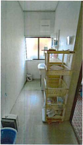
洗面所 2024.11 全面クロス張替、洗面台交換