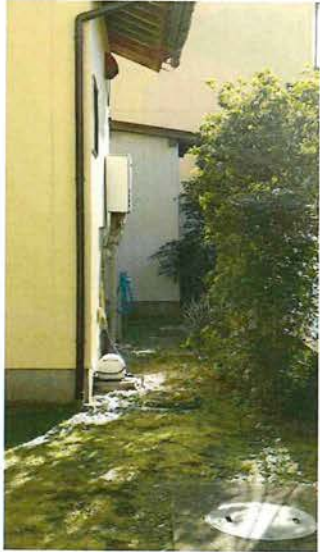
外観 裏側 2023.10ガス給湯器交換