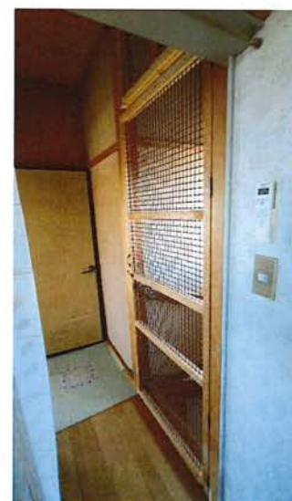
2階廊下部分 猫脱走防止扉