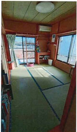
2階 和室(6畳) 2021.3 和紙畳へ張替