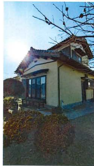
外観 東南側より 2015.9 瓦葺き替え 2018.9 外壁塗装