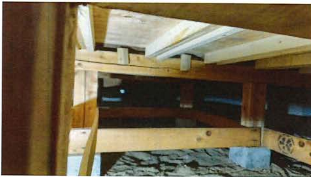
2025.2 DKの床下を全面補強 工事