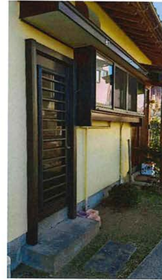
外観 2024.11 勝手口ドア交換、窓を ペアガラスへ交換