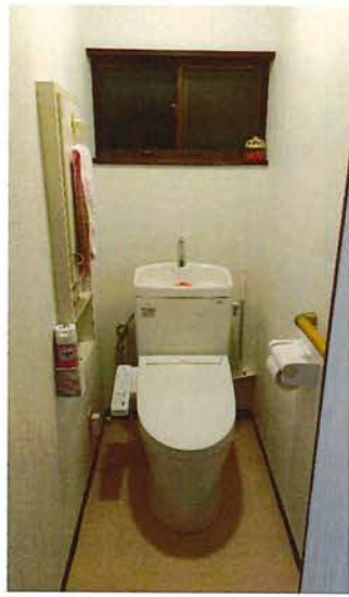
トイレ 2024.11 全面クロス張替、便器交換