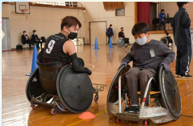
▲競技用車いすの操作を教える今井選手(左)と児童

パラリンピックの出場経験のある今井選手は、「これをきっかけに障害を持っている人に積極的に声をかけてくれるようになったらうれしい」と語りました。