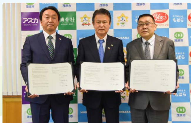
▲市民向け終活セミナーの開催も今後計画していきます