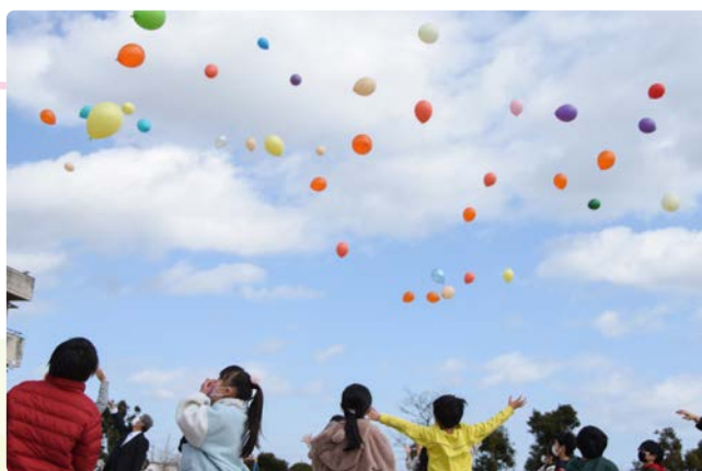
▲鶴枝小学校がこれからも続きますように！

式典後は、児童が学年ごとに鶴枝小学校や地域の歴史について歌や劇を交え発表。最後は、参加者全員がグラウンドで風船を一齐に飛ばし、空高く上がっていく光景に歓声と拍手が上がっていました。