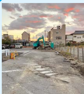
桑原八千代線道路改良工事の様子

当日は、全員協議会室において市の担当より、①茂原駅前通り地区土地区画整理事業の進捗状況について、②都市計画道路路桑原八千代線の進捗状況についての説明を受け、質疑を行い、委員から多くの意見や要望が出されました。