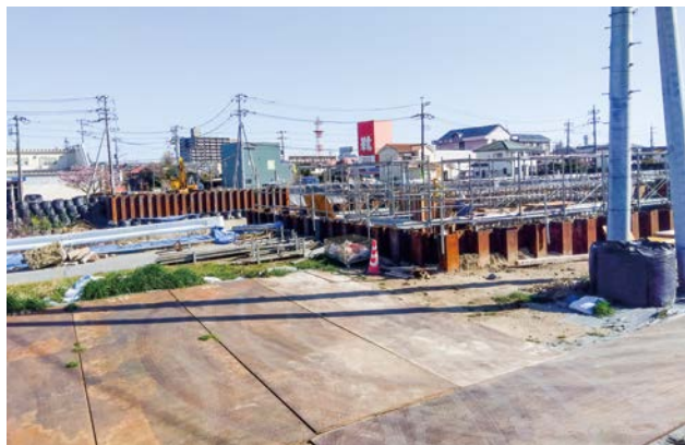
▲明治橋の架け替え工事

梅田川においては、第2石川橋の架け替えに伴う下部工事、乗川においては、吾妻崎橋の迂回路工の設計を予定しています。また、鹿島川、乗川および緑ヶ丘地先の横吹調整池の浚渫をはじめ、排水路の補修および草刈りを実施し、適正な維持管理に努めます。