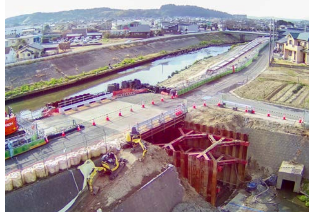
▲樋管拡大工事（内水対策）