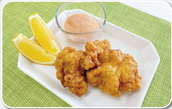
「鶏肉のフリッター」