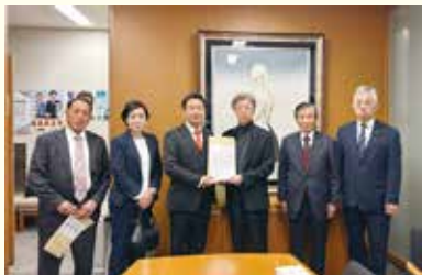
石井準一参議院議員