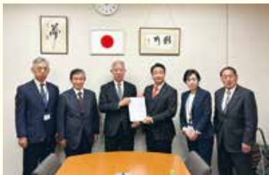
森英介衆議院議員

当要望活動は、令和元年度から継続して行っているものであり、住民の生命、財産を守るため一日も早い洪水被害の解消に向け、今後も市議会一丸となって活動してまいります。