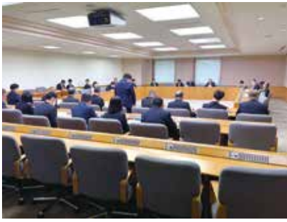
予算審査特別委員会審査風景