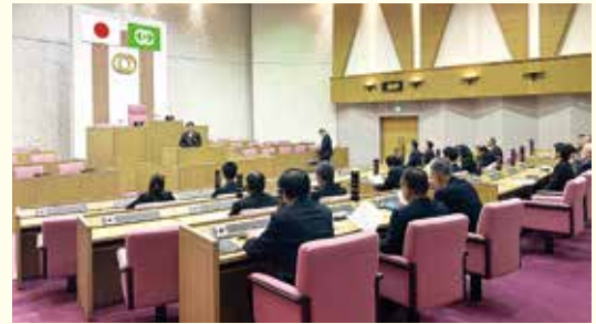
議会報告会撮影風景