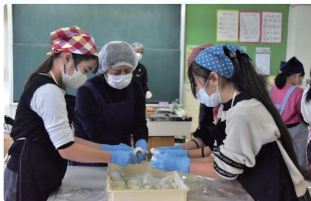
▲作り方を教わる児童たち

野菜を切ったり、もち米の生地にあんを包んだりする作業は難しそうな様子でしたが、最後はみんな笑顔で一生懸命作った餃子を味わっていました。