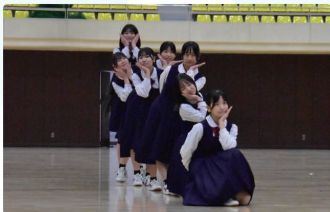
▲みんなの気持ちがそろう瞬間！