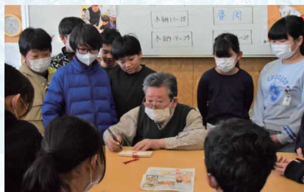
▲書き方をしっかり見ててね!