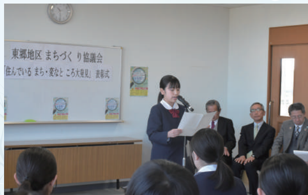
▲地元愛があるからこそその意見を發表します

富士見緑道の整備や防犯灯の設置、掩体壕の活用など、意見が多数集まり、その中から18人が表彰されました。会長賞を受賞した3人は内容の発表を行い、参加者は聞き入っていました。