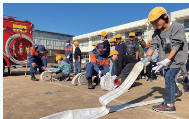
▲消防団員のアドバイスで、一生懸命ホースをのばしました