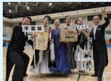
▲コヒヤマダンススクールの皆さん