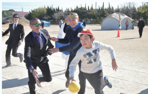
▲迫るハンターを振り切れ!

子どもたちは、ハンターから逃げながら、さまざまなミッションに挑戦。ボランティアとして参加した56人の保護者もイベントを楽しみ、参加者全員が笑顔溢れるひとときを過ごしました。