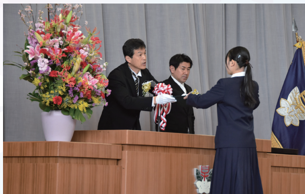
▲一人一人に声を掛ける校長先生

学校は閉校となりますが、育まれた絆や思い出は、卒業生たちの心の中に、そして地域の人々の記憶の中に、これからもずっと生き続けます。