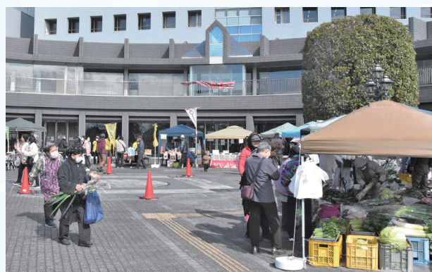
▲採れたての新鮮野菜が並びます