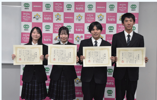
▲茂原高等学校生徒の皆さん

これは、委員の任期満了に伴う感謝状贈呈と、若い世代にも都市計画マスタープランを周知したいと同市民会議が茂原高等学校へ依頼し、市内に52カ所ある景観資源を題材にしたショート動画を作成したことに対し贈呈したものです。作成した動画は市YouTubeにて公開していますのでぜひご覧ください。