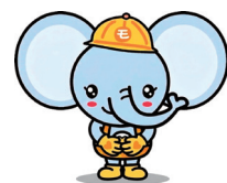
▲茂原市社協マスコットキャラクター「ふくぞう」

申込み・問合せ 茂原市社会福祉協議会 ☎(23)1969 FAX(23)6538