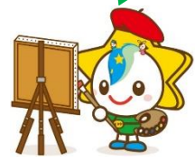
茂原市マスコットキャラクター「モバリん」